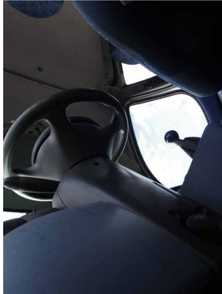
Terra cognita/Fiat Doblo, le voyage interieur Photos numériques. octobre 2021