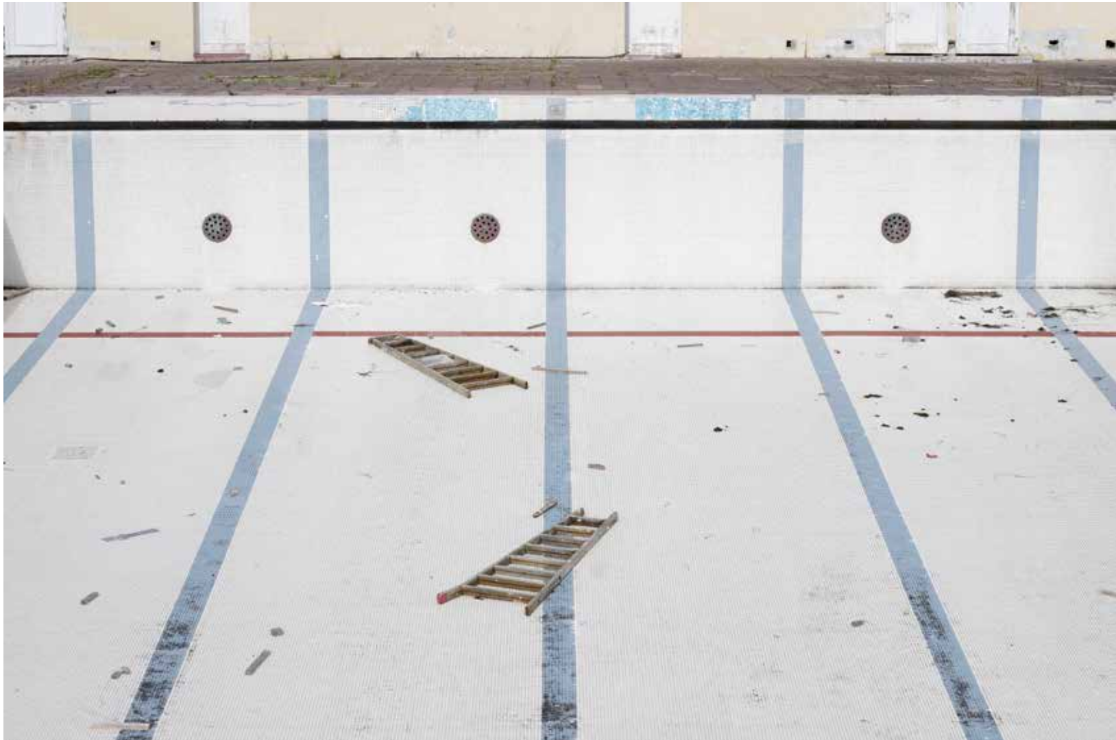
La piscine #8033 photographie numérique, octobre 2021