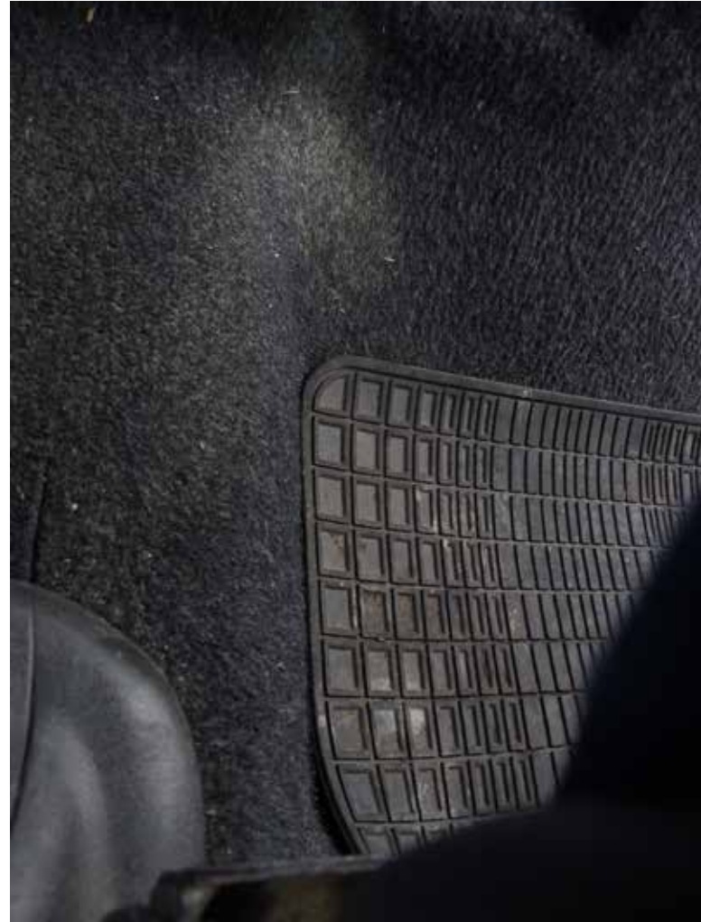
Terra cognita/Fiat Doblo, le voyage interieur Photos numériques. octobre 2021