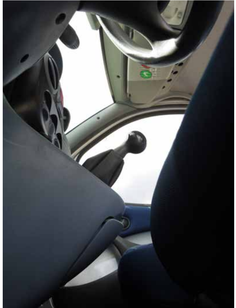
Terra cognita/Fiat Doblo, le voyage interieur Photos numériques. octobre 2021