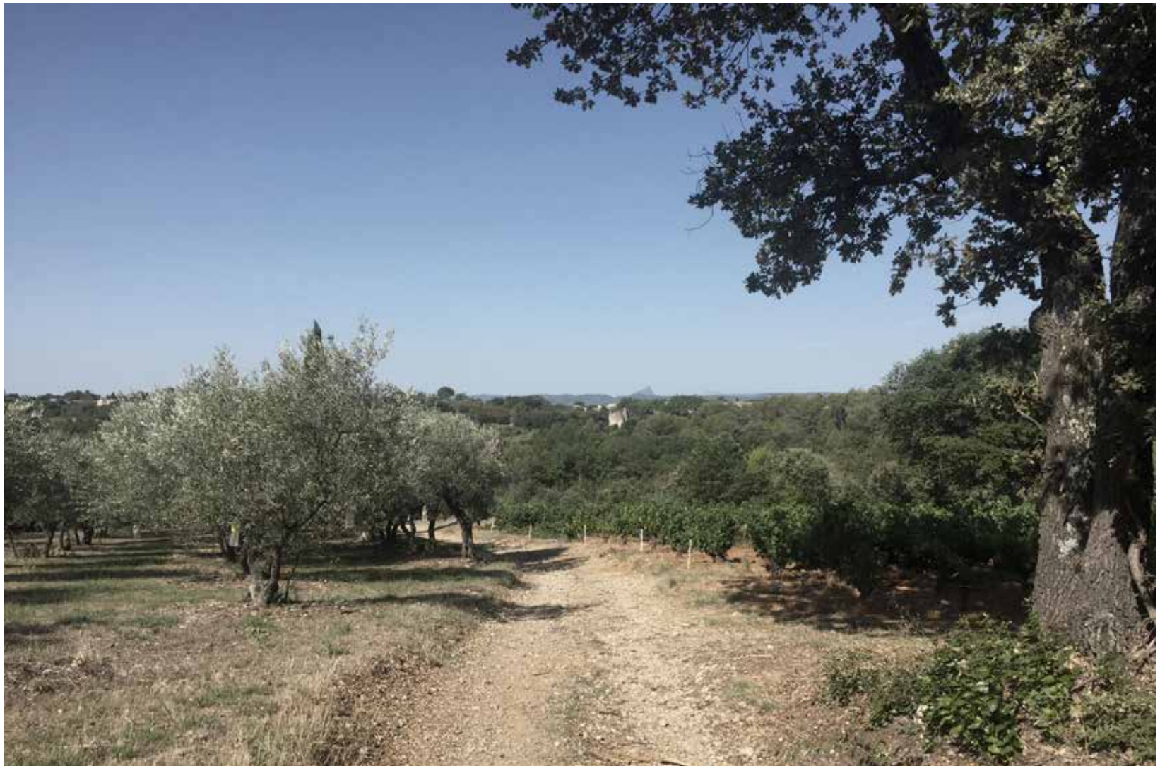
Esquisse senda a Norte photographie numérique, août 2021