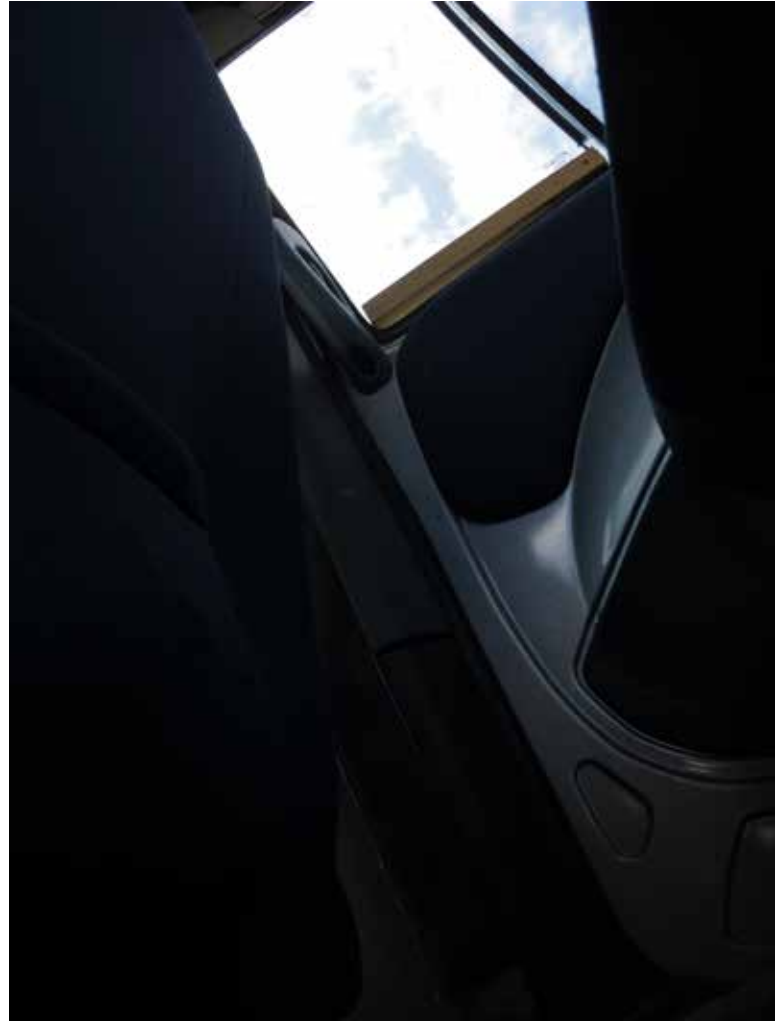
Terra cognita/Fiat Doblo, le voyage interieur Photos numériques. octobre 2021