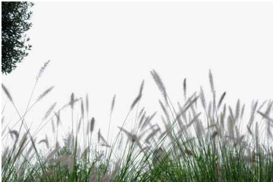
Lascaux quatre et demi. Etudes photographies numériques, octobre 2021